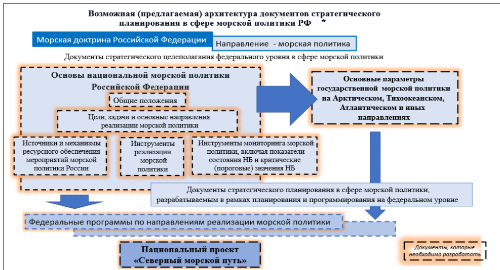
Рис. 2. Возможная архитектура документов стратегического планирования в сфере морской политики России

Возможная структура документов стратегического планирования в сфере морской политики России дана на рис. 2.